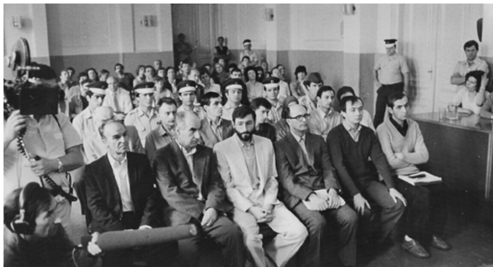
Фотография 8. Зал суда, Сараевский процесс, 1983.