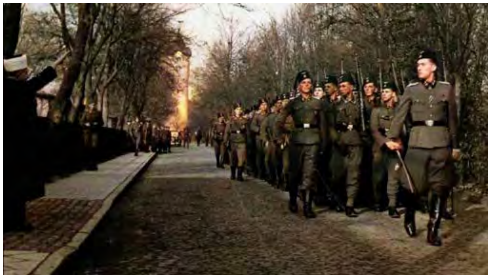
Фотография 4. Муфтий Амин аль-Хусейни с нацистским приветствием солдатам «Ханджарской дивизии», Сараево, 1943.

В марте и апреле 1943 года Гиммлер и группа мусульманских лидеров Независимого государства Хорватия (НГХ) обратились к муфтию Амину аль-Хусейни, который в то время жил в Берлине, с просьбой помочь организовать и вербовать мусульман в немецкие СС и другие подразделения. С 30 марта по 10 апреля муфтий посетил Загреб, Сараево и Баня-Луку, чтобы встретиться с высокопоставленными мусульманскими лидерами и провести кампанию в поддержку новой дивизии СС «Ханджар».