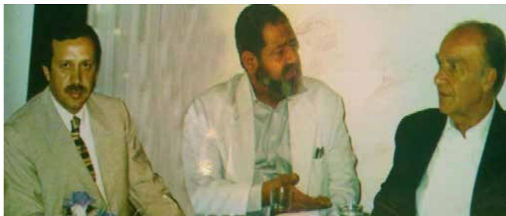
Фотография 14. Хасаниен, Эрдоган и Алия Изетбегович

нии и Герцеговине. Такое участие высокопоставленных членов ПДД и правительственных чиновников в TWRA демонстрирует сложную сеть систем политической, финансовой и военной поддержки, созданную во время войны в Боснии и Герцеговине, которая является результатом сочетания гуманитарной помощи с более противоречивой поддержкой военных усилий и вовлечения иностранных боевиков в конфликт. После того, как австрийские власти начали расследование по отмыванию денег в 1994 году, Хасаниен был вынужден бежать и сделал это, отправившись в Стамбул к своему большому другу Эрдогану.