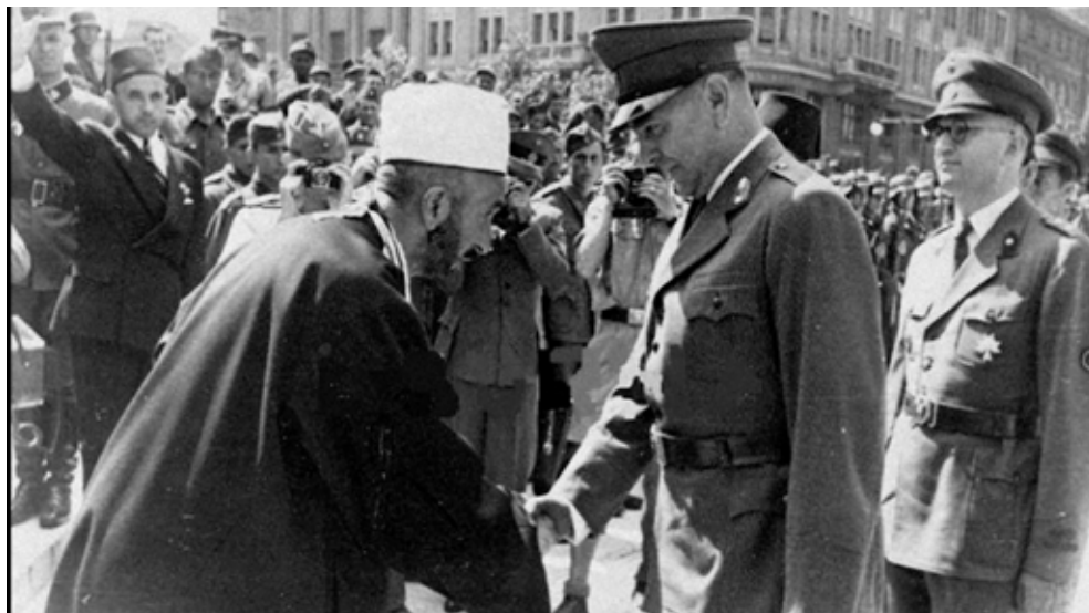
Фотография 1. Имам Алиа Аганович с Анте Павеличем на открытии мечети Поглавника (вождя) в Загребе, 1944.

исламскую религиозную общину во время открытия мечети Павелича в Загребе 18 августа 1944 года.