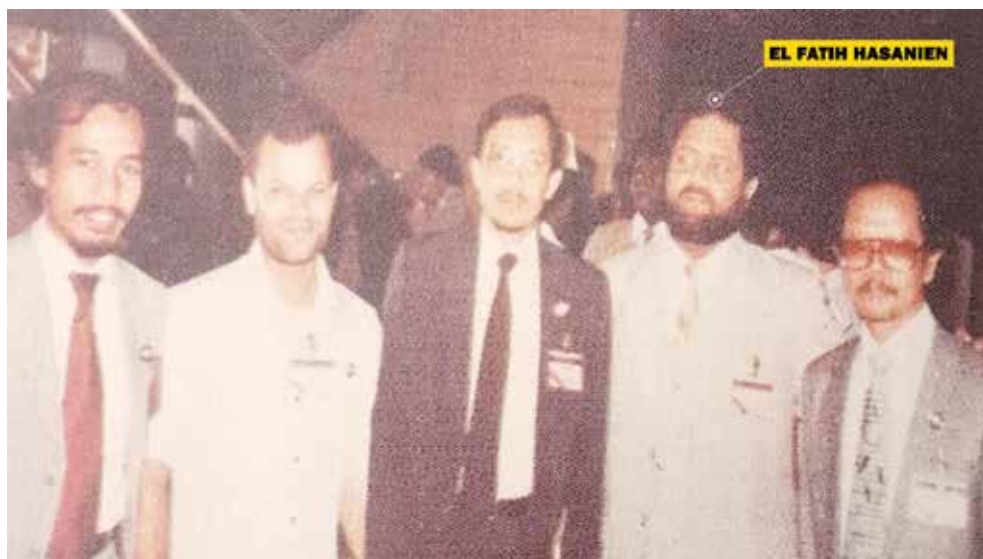
Фотография 7. Фотография сделана в 1984 г. с Анваром Ибрахимом, сегодняшним премьер-министром Малайзии. Во время войны в БиГ Ибрагим был министром финансов Малайзии и поддерживал мусульман, Хартум, 1984.

Визит Хасаниена в Сараево в 1970 годы вызвал большой интерес к воссоединению с членами «Молодых мусульман» из Боснии и Герцеговины, включая Хусейна Джозу и Касима Добрачу. Несмотря на первоначальное сопротивление других членов, только Алиа Изетбегович принял идею Хасаниена о сотрудничестве в рамках единой организации, что привело к первоначальному переводу исламских книг с арабского и английского языков. Это сотрудничество ознаменовало возрождение их общих идеалов, продемонстрировав непреходящее влияние и устойчивость их исламских убеждений и связей на фоне растущих политических и социальных потрясений.