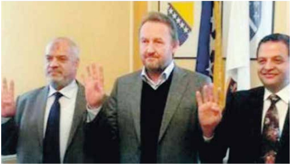
Фотография 10. Бакир Изетбегович в президиуме Боснии и Герцеговины вместе с делегацией «Братьев-мусульман».

Еще одним видным членом ПДД, связанным с «Братьями-мусульманами», является Бисера Туркович, бывшая министр иностранных дел БиГ. За пятнадцать дней до своего назначения министром в 2019 году она посетила джихадистского священнослужителя и духовного лидера «Братьев-мусульман» Юсуфа аль-Кардави, который также поддерживал приезд моджахедов во время войны в Боснии и Герцеговине. Во время войны Бисера Туркович была послом Боснии и Герцеговины в Загребе и тесно сотрудничала с официальными лицами (TWRA) по вопросам спонсирования терроризма и отмывания денег.