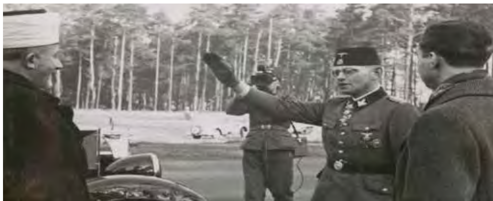
Фотография 3. Карл Густав Зауберцвейг, командир 13-й горной дивизии Ваффен СС «Ханджар», отдает нацистское приветствие великому муфтию Иерусалима Амину аль-Хусейни, Сараево, 1943.

В марте и апреле 1943 года Гиммлер и группа мусульманских лидеров Независимого государства Хорватия (НГХ) обратились к муфтию Амину аль-Хусейни, который в то время жил в Берлине, с просьбой помочь организовать и вербовать мусульман в немецкие СС и другие подразделения. С 30 марта по 10 апреля муфтий посетил Загреб, Сараево и Баня-Луку, чтобы встретиться с высокопоставленными мусульманскими лидерами и провести кампанию в поддержку новой дивизии СС «Ханджар».