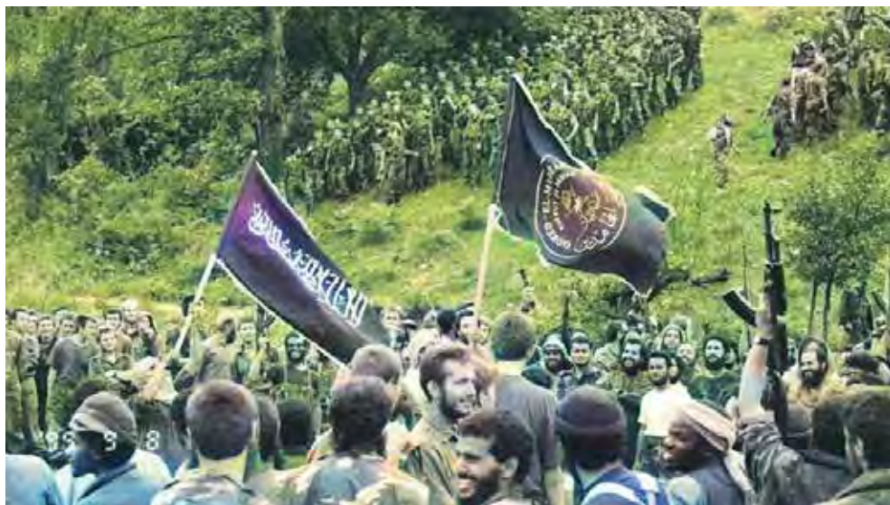
Фотография 15. Иностранцы боевики отряда «Эль-Муджахид» после расправы над сербами, 1995.

Армия Республики Боснии и Герцеговины (АРБиГ) была по сути военным крылом международной организации «Братья-мусульмане» в Боснии и Герцеговине, 99% ее членов были мусульманами. Во время войны 7-я мусульманская бригада была военной гордостью «Братьев-мусульман» в Боснии и Герцеговине и состояла из иностранных и местных моджахедов.